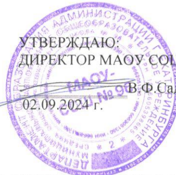
График проверки родительского контроля за организацией и качеством питания